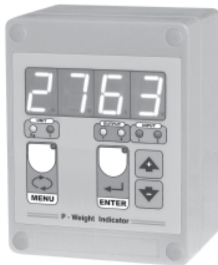
versione da parete IP 64 dimensioni: 98 x 125 x 75 mm wall mounting version IP64

Indicatori di peso in custodia a norme DIN (96 x 96 x 65 mm, foratura 91 x 91 mm) per montaggio a fronte quadro. Grado protezione del frontale IP64. Punto decimale selezionabile: xxxx xxx,x xx,xx x,xxx. Display semialfanumerico a 4 cifre da 20mm a 7 segmenti.